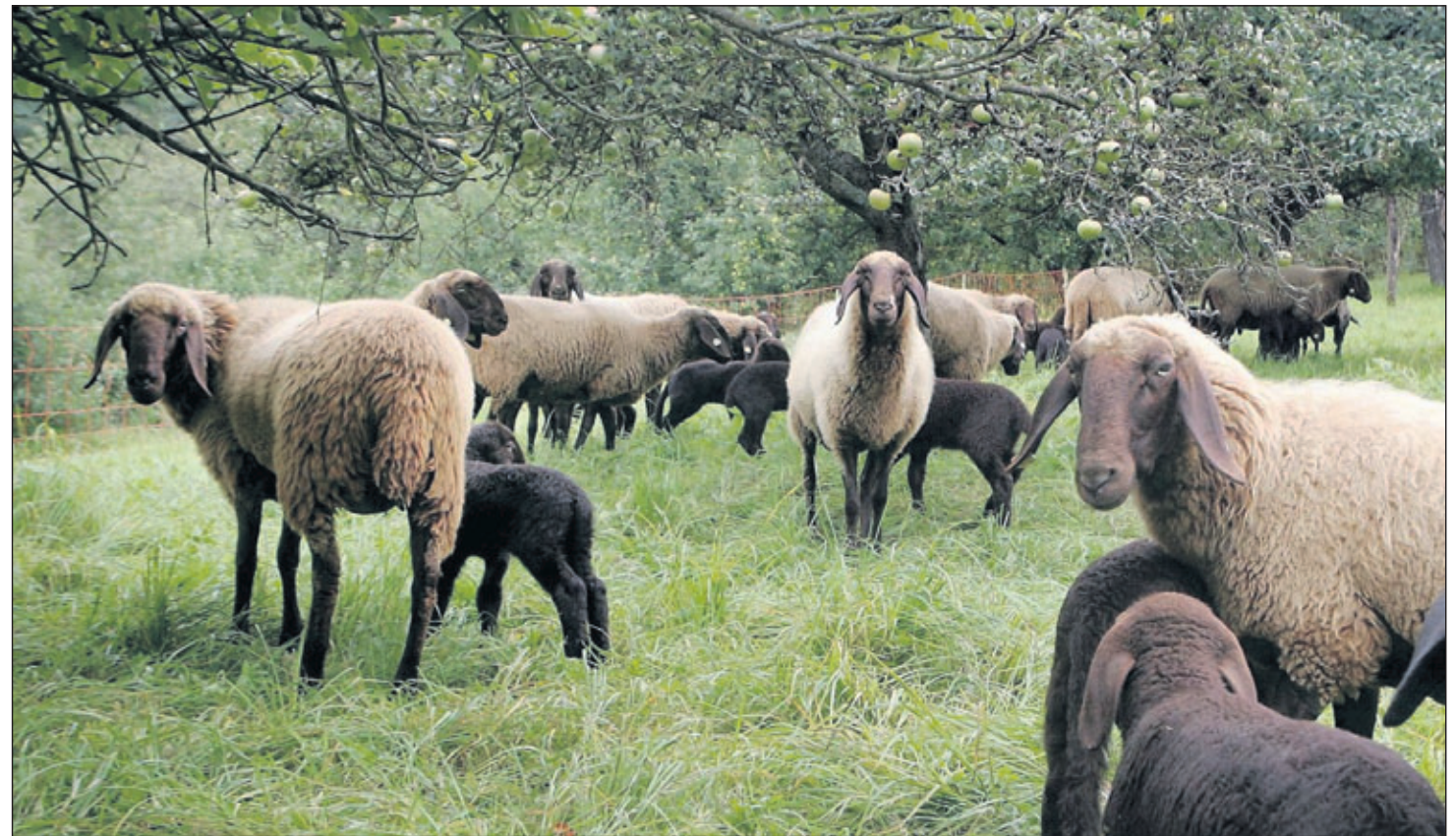
Ein Beweidungsprojekt wie hier bei Kleinheppach könnte die Kammerforstheide dauerhaft ökologisch aufwerten. Die Eigner sind am Zug.

Bei einer Info-Veranstaltung am 17. November im Stettener Feuerwehrgerätehaus sollen die 89 Stücklesbesitzer, denen auf der acht Hektar großen Fläche zwischen Wald und Rebflur 124 Parzellen gehören über die Modalitäten einer Flurbereinigung im Detail informiert werden. Die unattraktiv schmalen Parzellen in der Hanglage sollen dabei neu zugeschnitten werden. Um das Streuobstgelände als zusammenhängende Weidefläche nutzen zu können, wäre freilich ein relativ